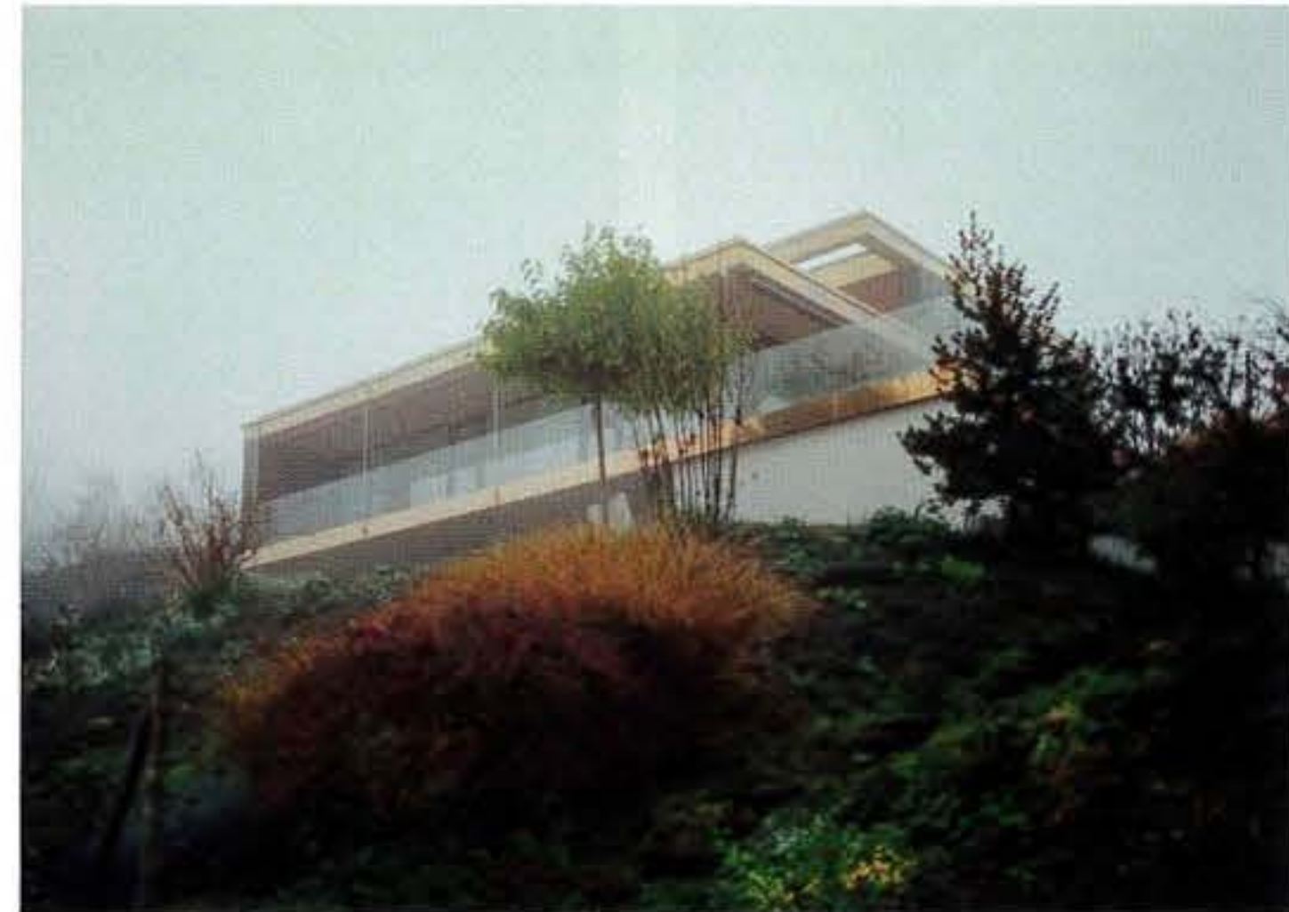
Umbau eines 1970er-Jahre-Einfamilienhauses in Oberrohrdorf

Ein weiteres aktuelles Projekt, das die Architektengemeinschaft 4 AG im Jahr 2018 fertiggestellt hat, ist der Umbau eines Einfamilienhauses an der Luxmattenstrasse in Oberrohrdorf. Das Wohngebäude stammt aus den 1970er Jahren und forderte eine neue Lösung. Statt Abriss und Neubau wurde eine umfassende Sanierung durchgeführt. Dies beinhaltete anstelle des alten Satteldachs die Aufstockung um eine ganz neue Etage. Von hier profitiert man von freier Sicht weit in das Reusstal. Doch auch im bestehenden Wohnzimmer im Erdgeschoss eröffnen sich neue Perspektiven. Heute wird der Wohnbereich auf eine grosszügige Terrasse mit hoher Aufenthaltsqualität nach aussen erweitert, die einladend den Übergang in den Garten moderiert. Für die Umbauten kam viel Holz zum Einsatz. Nach aussen akzentuieren Kupferbänder die horizontale Schichtung der Wohnebenen. Zudem tragen sie dazu bei, Alt und Neu in eine eigenständige, zeitgemässe Identität optisch zu integrieren und so die Beliebigkeit der Siebzigerjahre-Architektur vergessen zu lassen.