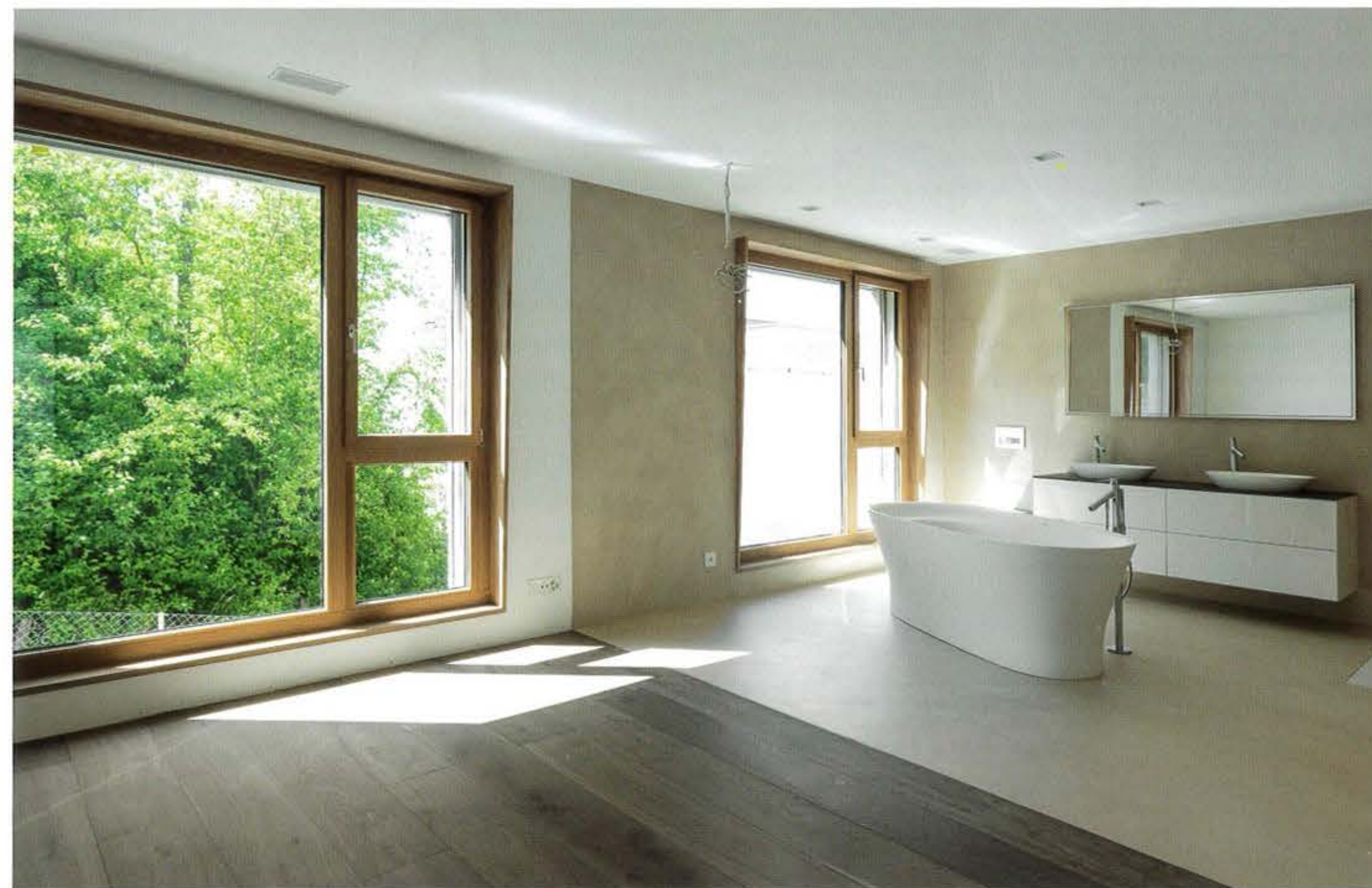
Mehrfamilienhäuser Hirschparkweg in Zofingen Abbildungen: Architekten Gemeinschaft 4 AG

Die Umgebung wurde bewusst und konsequent naturbelassen gehalten, um so einerseits die lokale Biodiversität zu respektieren und andererseits die naturnahe Wohnqualität zu wahren. Grosszügige, raumhohe Fensterelemente gewährleisten intensive Bezüge zur Umgebung und unterstützen das offene Raumambiente. Indem die Formate durchgängig gleichmässig dimensioniert wurden, erleichtern sie den Bewohnern eine maximale Freiheit in der individuellen Raumnutzung.